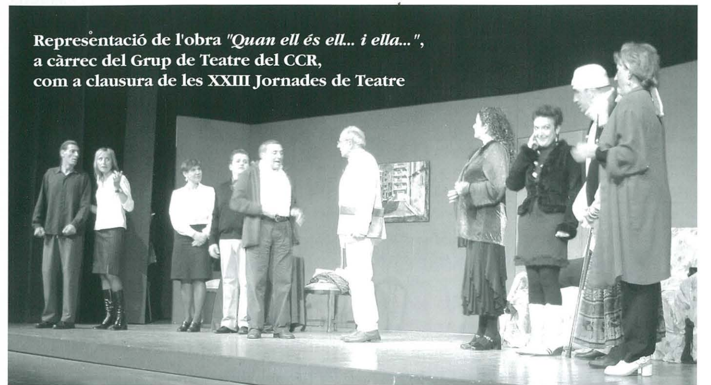
Representació de l'obra "Quan ell és ell... i ella...", a càrrec del Grup de Teatre del CCR, com a clausura de les XXIII Jornades de Teatre