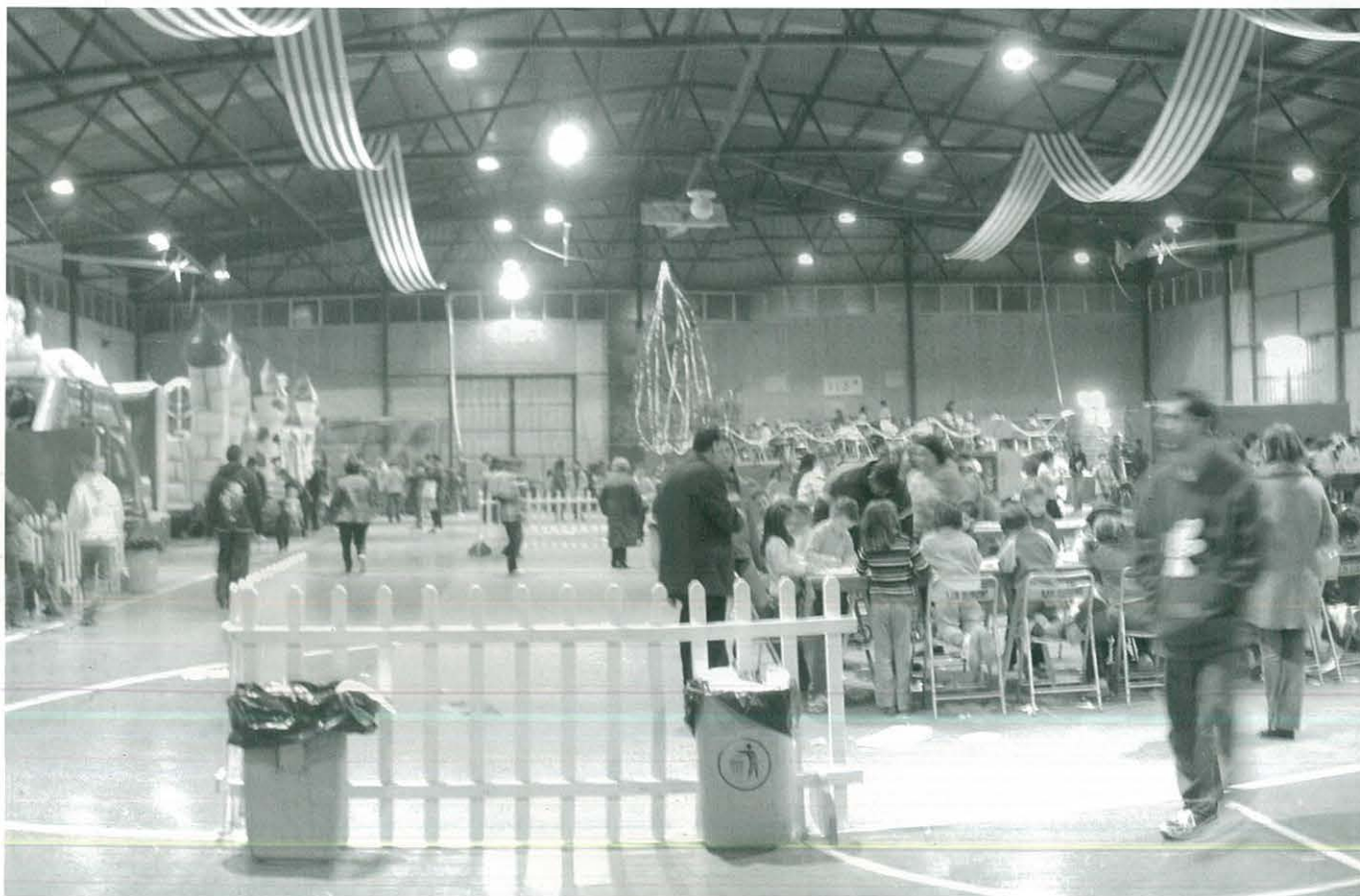
Participació del CCR al Parc Infantil de Nadal d'Ulldecona